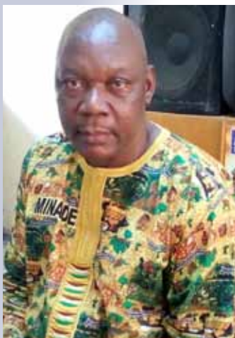
Nous sommes 250.000 producteurs à prendre en compte.

C'est officiel, le Coronavirus a atteint la région du Nord. Comment réagit la plus grande fédération de producteurs agricoles du Septentrion que vous représentez?