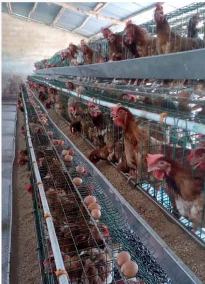
Un fermier ne peut pas se confiner.

En outre, le soir après le boulot, certains le consomment dans des gargotes ou dans les bars équipés de rôtisseries. Mais du 17 mars au 30 avril 2020, tout était fermé à partir de 18 heures et même toute la journée