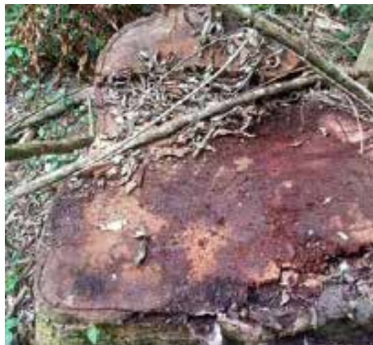
Photo : souche de Kotali non marquée dans la VC 10 02 423 ; GPS 3,8364 ; 12,8045

Dans les ventes de coupe délocalisées visitées, il est constaté que l'exploitation ne respectait pas les normes d'intervention en milieu forestier. Il a été observé la non délimitation du titre, le non marquage des souches et coursons et le non-respect du diamètre minimum d'exploitabilité. La possibilité donnée dans les arrêtés d'attribution de ces ventes de coupe aux exploitants de recourir à leur guise a différentes approches de traitement sylvicole conduit ainsi à des dérives et irrégularités observables sur le terrain. Les photos ci-dessous sont une illustration des images et réalités observées sur le terrain. Elles montrent des cas de non-respect clair des normes d'exploitation telles que prescrites par la Décision No 0108/D/MINEF/CAB du 09 février 1998 portant Normes d'intervention en milieu forestier, notamment en ce qui concerne la coupe et le marquage des souches d'arbres coupés.