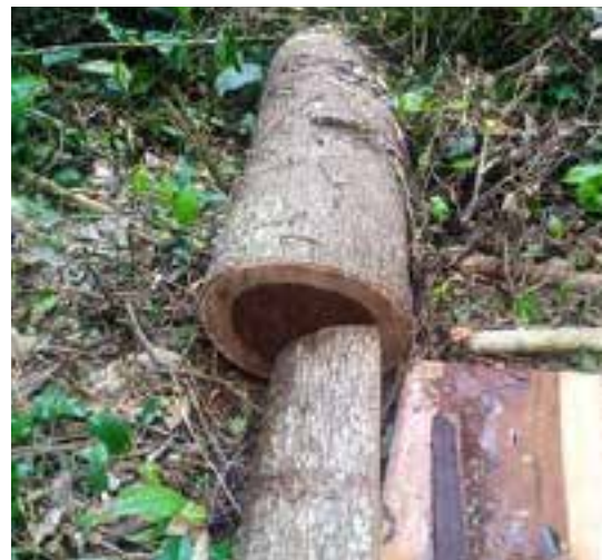
Photo : Sapelli exploité sous diamètre dans la VC 10 02 423 ; GPS : 3,8378 ; 12,8045

Par ailleurs, l'observation a été faite que nombre de ces exploitations se font hors limite et même dans les plantations des villageois. C'est le cas des communautés riveraines à la vente de coupe N° 10 02 422 « Parfois c'est nous même qui leur proposons nos arbres ... Si un villageois a un pied de Tali ou de Kotali dans son champ, il vend... il discute le prix avec le représentant de l'exploitant ici et parfois le prix le plus élevé est 200 000 FCFA le pied », affirme un habitant.