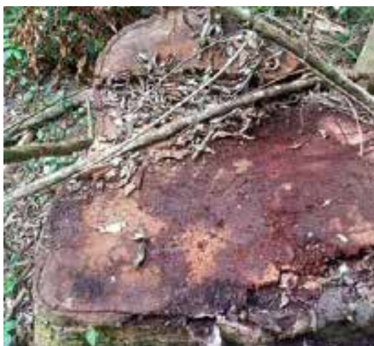
Photo : souche de Kotali non marquée dans la VC 10 02 423 ; GPS 3,8364 ; 12,8045

Dans les ventes de coupe délocalisées visitées, il est constaté que l'exploitation ne respectait pas les normes d'intervention en milieu forestier. Il a été observé la non délimitation du titre, le non marquage des souches et coursons et le non-respect du diamètre minimum d'exploitabilité. La possibilité donnée dans les arrêtés d'attribution de ces ventes de coupe aux exploitants de recourir à leur guise a différentes approches de traitement sylvicole conduit ainsi à des dérives et irrégularités observables sur le terrain. Les photos ci-dessous sont une illustration des images et réalités observées sur le terrain. Elles montrent des cas de non-respect clair des normes d'exploitation telles que prescrites par la Décision No 0108/D/MINEF/CAB du 09 février 1998 portant Normes d'intervention en milieu forestier, notamment en ce qui concerne la coupe et le marquage des souches d'arbres coupés.