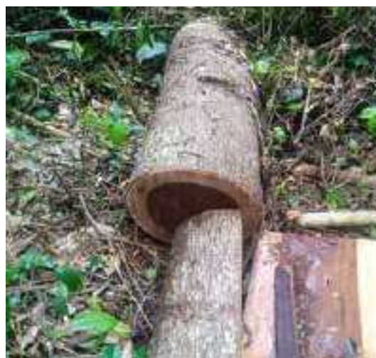
Photo : Sapelli exploité sous diamètre dans la VC 10 02 423 ; GPS : 3,8378 ; 12,8045

Par ailleurs, l'observation a été faite que nombre de ces exploitations se font hors limite et même dans les plantations des villageois. C'est le cas des communautés riveraines à la vente de coupe N° 10 02 422 « Parfois c'est nous même qui leur proposons nos arbres ... Si un villageois a un pied de Tali ou de Kotali dans son champ, il vend... il discute le prix avec le représentant de l'exploitant ici et parfois le prix le plus élevé est 200 000 FCFA le pied », affirme un habitant.